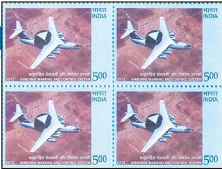
Система AWACS на марке Индии. 2012 г.