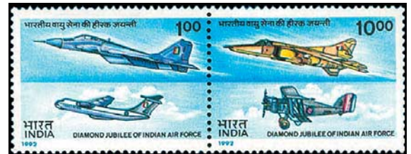
Выпуск к 60-летию индийских ВВС

10 октября 2003 года Индия, Израиль и Россия подписали соглашение о продаже Индии системы дальнего радиолокационного обнаружения (ДРЛО) воздушного базирования «Фалькон» (falcon – сокол, англ.)