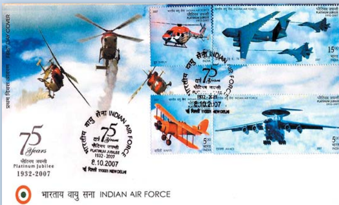
КПД с марками, где изображены «Фалькон» и Ил-76 танкер. 2007 г.