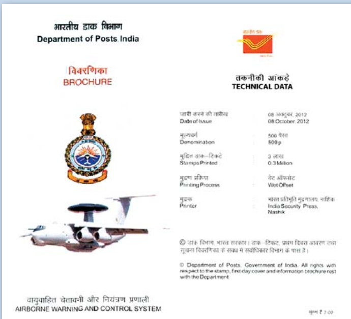
Информационный буклет. 2012 г.