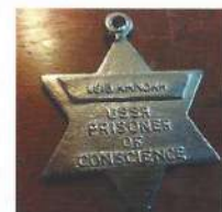
Лейб Ханок (самолётное дело)