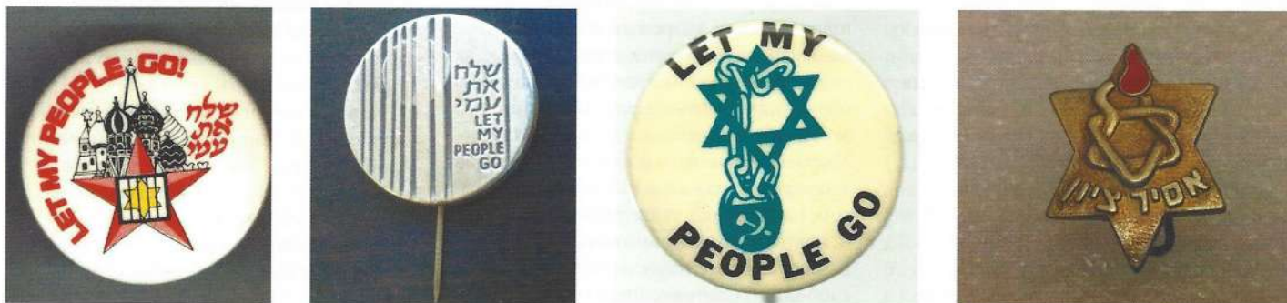
Рис. 1. Образцы агитационных знаков

В среде советских евреев всегда было определенное количество мечтавших о репатриации в Израиль. Имевший место в СССР бытовой антисемитизм в послевоенное время дополнился государственным. Такое положение стимулировало желание евреев выехать из Советского Союза. Победа Израиля над арабскими странами в Шестидневной войне подняла волну национального самосознания евреев всего мира и в частности советских евреев. Многочисленные просьбы о выезде в Израиль в большинстве случаев отклонялись, создавая все увеличивающуюся группу отказников. Оказавшиеся в отказе люди, как правило, лишались возможности заниматься профессиональной деятельностью, оказывались в тяжелом материальном положении. Многие из них были доведены до отчаяния. Оказавшиеся в отказе люди писали петиции к властям и открытые письма — индивидуальные и коллективные, как с изложением проблем своей семьи и просьбой о разрешении на выезд, так и с протестами против нарушения права на эмиграцию, против национальной дискриминации евреев, а также против антисемитских кампаний в советской прессе.