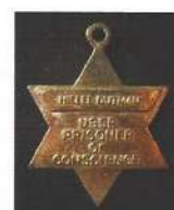
Гиллель Бутман (осужден по "Второму ленинградскому процессу")