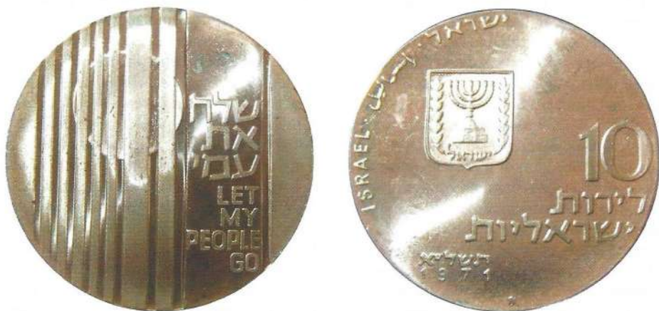
Рис. 2. Памятная израильская серебряная монета 10 лир «Let My People Go», 1971 г.