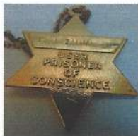
Израиль Зальмансон (самолётное дело)