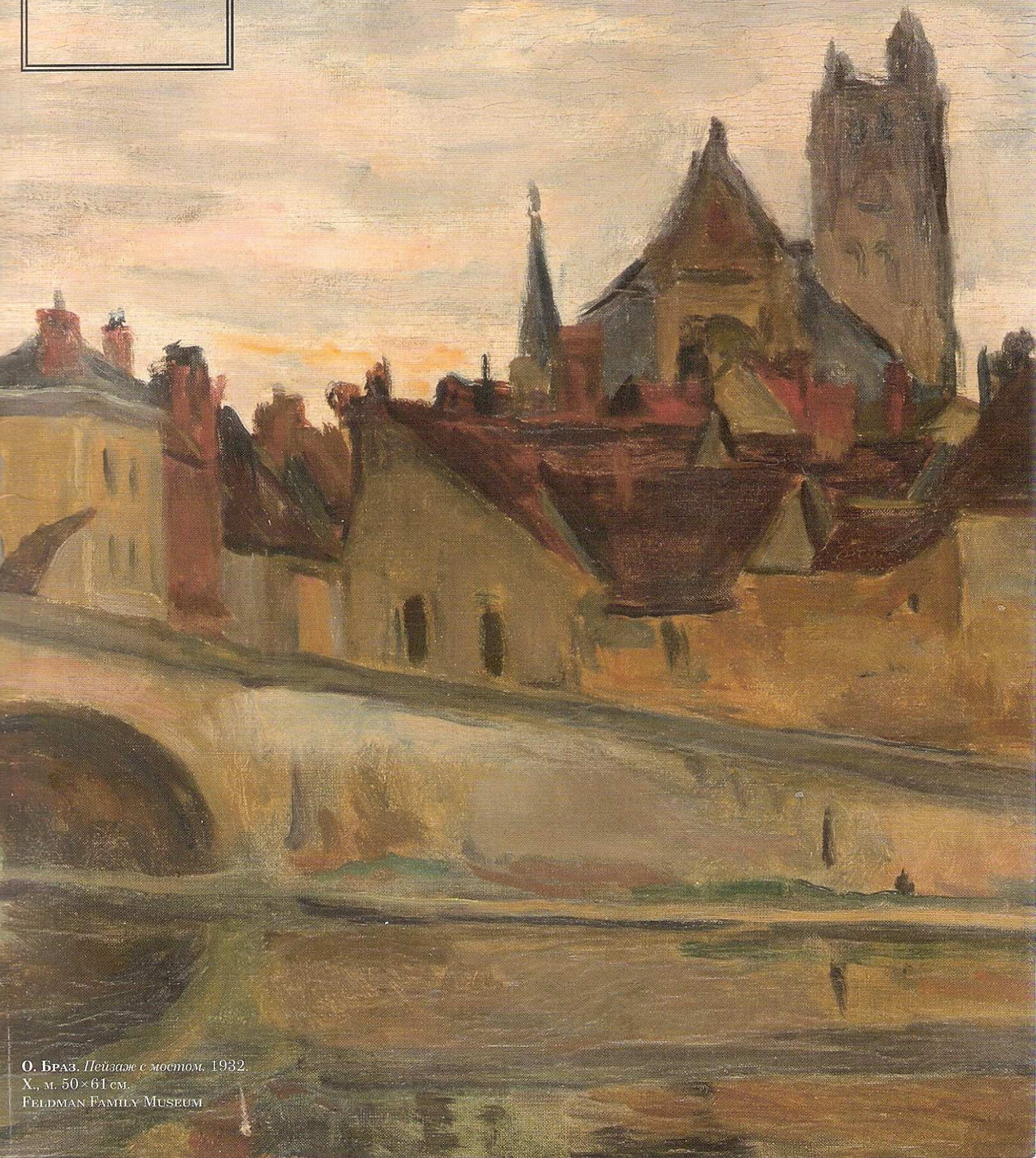
О. БРАЗ. Пейзаж с мостом. 1932. Х., м. 50 × 61 см.

Журнал об антиквариате, искусстве и коллекционировании