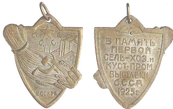
Илл. 1. Советский жетон в память Первой Всероссийской сельскохозяйственной кустарно-промышленной выставки

До разрыва дипломатических отношений в 1967 году Израиль участвовал в трёх международных выставках, к проведению которых были изготовлены специальные значки.