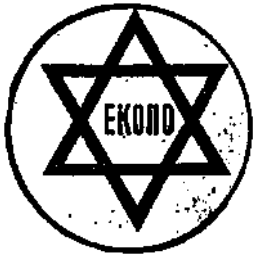
Виньетка ЕКОПО (рис. из каталога А. Бовы, А. Лукьянова, Ю. Турчинского; цвет и размеры неизвестны)