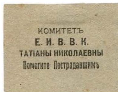
Благотворительные виньетки Татьянинского комитета. Херсон. 42×32 мм. Типографская печать. Бумага красная, зеленоватая, серая

синагогах и других помещениях. Впоследствии работникам ЕКОПО удалось получить для многих из этих людей разрешение остаться в городе. Для них же при Рижском отделении Комитета был организован лазарет.