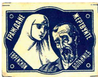
Благотворительная виньетка Одесской еврейской больницы. 54×39 мм (с полями). Синяя. Литография