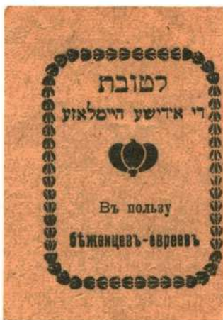
Благотворительная виньетка «В пользу беженцев-евреев». Одесса. 1916. 21 × 42 мм. Типографская печать (в каталоге А. Н. Недайводина № 1917)

Авторы просят читателей, располагающих информацией о других еврейских благотворительных марках России начала XX века или дополнительными сведениями об описанных в данной статье, сообщить нам об этом по электронной почте: