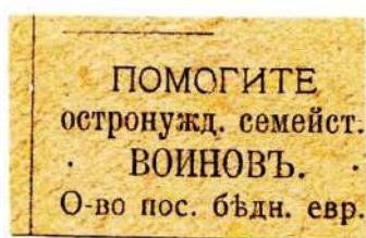
Благотворительные виньетки Общества пособия бедным евреям. Кишинёв. 1917. 45×25 мм. Типографская печать. Бумага желтоватая и серая