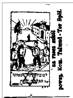
Благотворительная виньетка «Для объединённого комитета талмуд-тора». Вильно. 38 × 52 мм (с полями). Чёрная

В 1914 году в русской армии служило 400 тысяч солдат-евреев, к концу 1916 года их число возросло почти до 600 тысяч. Из них более 100 тысяч погибли на полях сражений, более 200 тысяч получили ранения. Свыше 3000 еврейских солдат были награждены Георгиевскими крестами, более 40 стали кавалерами «полного банта», то есть имели Георгиевские