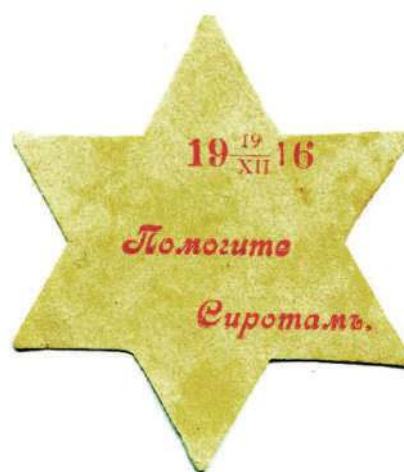
Благотворительная виньетка. 19.12.1916. 65 мм (по диагонали). Литография. Бумага белая