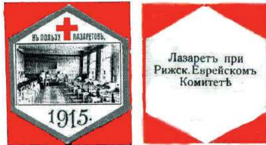
Виньетка лазарета при Рижскомъ отделении ЕКОПО. 1915 (в каталоге А. Н. Недаиводина, № 2119 и № 2142)

кресты всех четырёх степеней. Перед еврейской общиной встал вопрос об оказании материальной помощи десяткам тысяч еврейских семей, члены которых были призваны в армию, а также воинам-инвалидам.