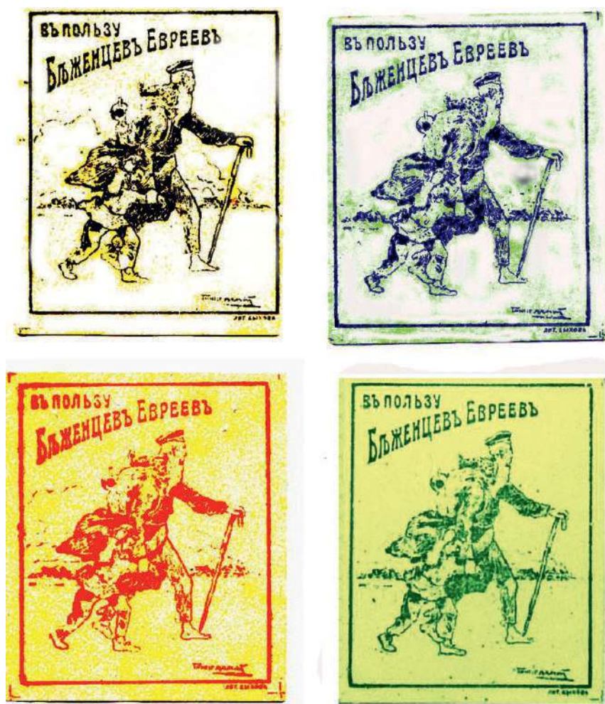
Благотворительные винетки «В пользу беженцев-евреев». Тифлис. 1915. Литография Быкова. 40×50 мм. Известны чёрные, синие, красные и зелёные. Подпись художника неразборчивая (в каталоге А. Н. Недайводина № 2767 и № 2768)

florenpv@kmail.ru и fnbern@gmail.com. Заранее благодарны.