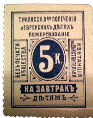
Благотворительная марка Тифлисского Общества попечения о еврейских детях