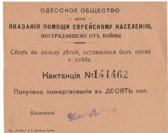
Квитанции из чековой книжки с односторонней зубцовкой 11½. Одесса. 1915. Типографская печать. Бумага зеленоватая и кремовая (в каталоге А. Н. Недайводина № 1888 и № 1889)