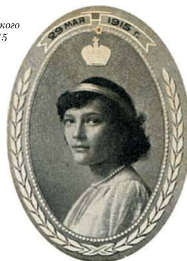
Благотворительная виньетка Татьянинского комитета. 29.05.1915