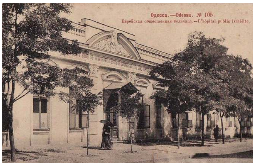
Фотооткрытка «Одесса. Еврейская общественная больница». Москва: Фототипия Шерер, Набгольц и Ко, 1903

Выпуском благотворительных марок занималось также Общество помощи больным «Эзрас Хойлим», созданное в Одессе в 1906 году по инициативе раввина Гликсберга, руководившего им в течение