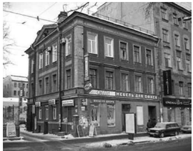
Дом на Лиговском проспекте, 61, где была устроена еврейская дешёвая столовая

Благотворительность распространялась и на учебные заведения, для поддержания деятельности которых также выпускались специальные марки