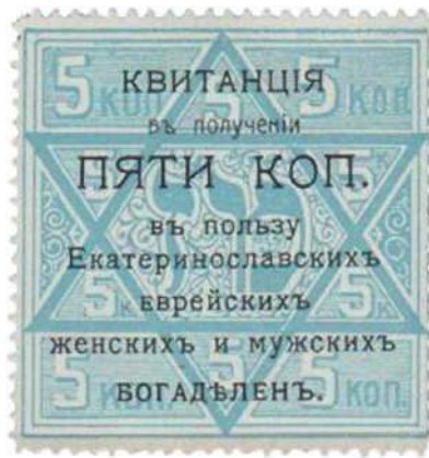
Лицевая и обратная стороны марки-квитанции, подтверждающей пожертвование в пользу Екатеринославских еврейских богаделен. 48×47 мм; диаметр печати 46 мм