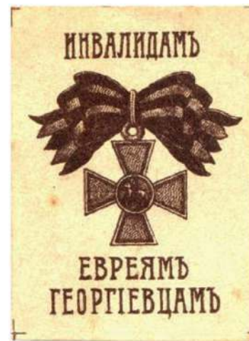
Виньетка «Инвалидам евреев-гергиевцам». Одесса. 1916. 32×95 мм. Типографская печать (в каталоге А. Н. Недаиводина № 1933)