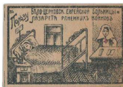
Благотворительная виньетка Белоцерковской еврейской больницы

На лицевой стороне виньетки «Эзрас-Хойлим» наряду с изображением цветка размещено название Общества — русскими буквами и на иврите. На обороте — надпись