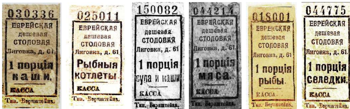
Талоны на питание в еврейской дешёвой столовой

и виньетки. На одной из них, напечатанной в Вильно, на иврите и польском языках написано: «Для объединённого комитета талмуд-тора».