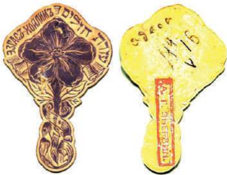
Лицевая и обратная стороны виньетки Общества «Эзрас-Хойлим». 30×45 мм. Лиловая. Тиснение