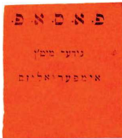
Рис. 10. 1917, Киев. 40×45 мм. Чёрная печать на красной бумаге. Аббревиатура и текст на идиш: ОЕСРП. «Долой империализм»