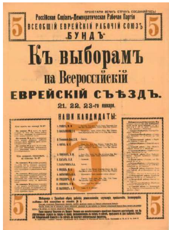
Рис. 15. Агитационный плакат Бунда к выборам на Всероссийский еврейский съезд. Петроград. 1917. Бумага, высокая печать. 64 × 47,5 см