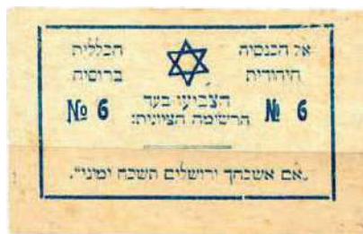
Рис. 26. Текст на иврите: На Всероссийский еврейский съезд. Голосуйте за сионистский список №6. «Если я забуду тебя, Иерусалим, — забудь меня десница моя» (Псалом 136:5)