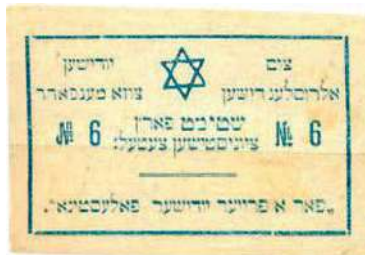
Рис. 21. Текст на идиш: На Всероссийский еврейский съезд. Голосуйте за сионистский список № 6. «За свободную еврейскую Палестину»