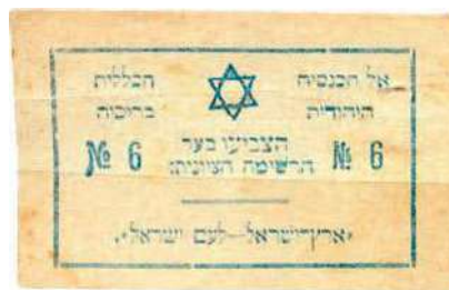
Рис. 27. Текст на иврите: На Всероссийский еврейский съезд. Голосуйте за сионистский список №6. «Страна Израиля — Народу Израиля»