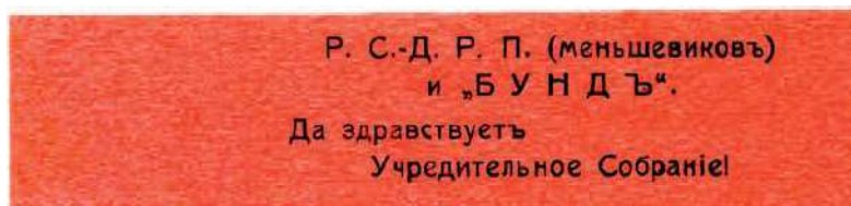
Рис. 1. Июль 1917 г., Саратов. 102×32 мм. Чёрная литографическая печать на красной плотной бумаге (каталог А. Н. Недаиводина: т. 1 (9), № 650)

Выборы проводились по партийным спискам, при этом общероссийских списков не существовало. Россия была разделена на избирательные округа, в каждом из которых партии формировали и выдвигали самостоятельные списки. Набор таких списков