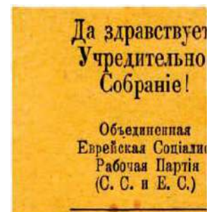
Рис. 4. 1917, Киев. ОЕСРП. 45×35 мм. Чёрная печать на жёлтой бумаге