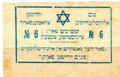
Рис. 23. Текст на идиш: На Всероссийский еврейский съезд. Голосуйте за сионистский список № 6. «За целостность и единство еврейского народа»