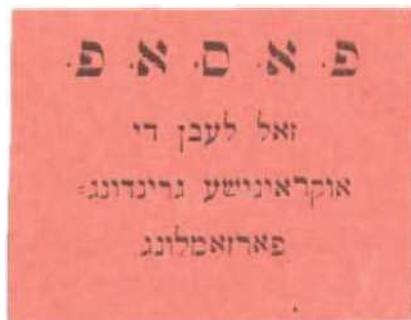
Рис. 7. Киев. 40×47 мм. Чёрная печать на тонкой розовой бумаге. Аббревиатура и текст на идиш: ОЕСРП. «Да здравствует Украинское учредительное собрание»