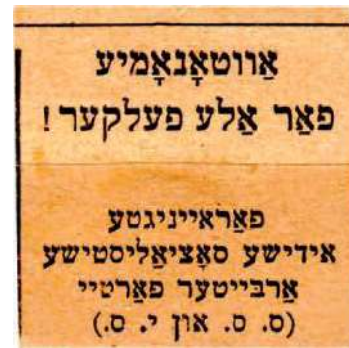
Рис. 14. Текст на идиш: «Автономии для всех народов! Объединённая еврейская социалистическая рабочая партия»