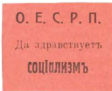
Рис. 11. 1917, Киев. Чёрная печать на тонкой розовой бумаге

В июле 1917 года в Петрограде состоялась конференция еврейских политических партий и организаций, где было принято решение о созыве Всероссийского еврейского съезда. Участники конференции избрали оргкомитет