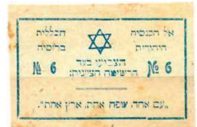
Рис. 25. Текст на иврите: На Всероссийский еврейский съезд. Голосуйте за сионистский список № 6. «Один народ, один язык, одна страна»