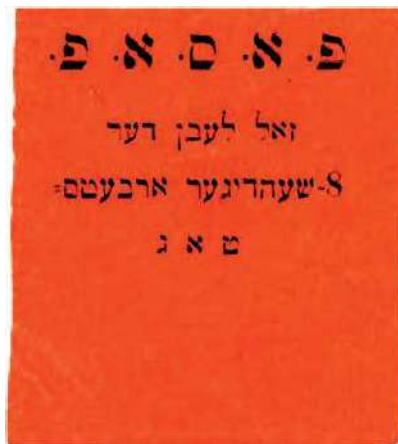
Рис. 9. 1917, Киев. 40×45 мм. Чёрная печать на красной бумаге. Аббревиатура и текст на идиш: ОЕСРП. «Да здравствует 8-часовой рабочий день»