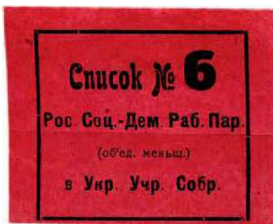
Рис. 6. 1917, Киев. 59×47 мм; рамка 47×39 мм. Чёрная литографская печать на тёмно-красной бумаге