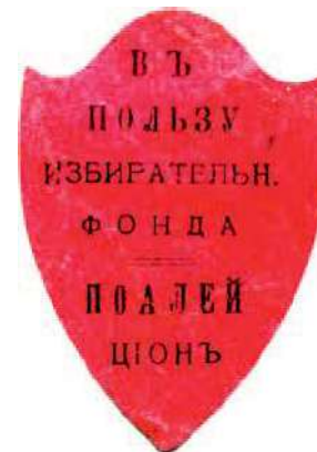
Рис. 29. Астрахань. Виньетка партии Поалей-Цион. 37 × 53 мм. Чёрная печать на тёмно-красной плотной бумаге