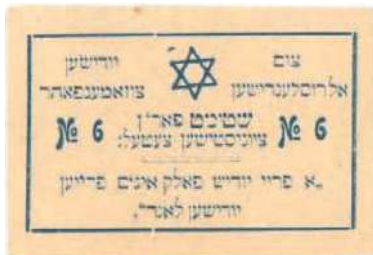
Рис. 20. Текст на идиш: На Всероссийский еврейский съезд. Голосуйте за сионистский список № 6. «Свободный еврейский народ на свободной еврейской земле»

На рис. 20–27 представлены виньетки, выпущенные сионистами в Киеве в 1917 году к выборам на Всероссийский еврейский съезд. Все они отпечатаны