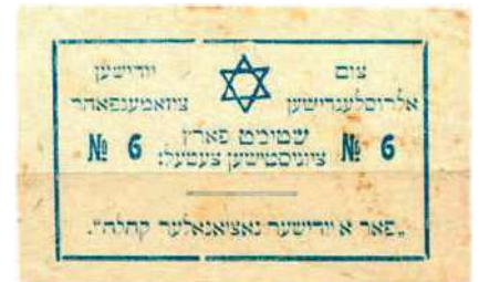
Рис. 22. Текст на идиш: На Всероссийский еврейский съезд. Голосуйте за сионистский список № 6. «За еврейскую национальную общину»