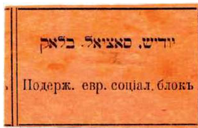
Рис. 18. 1917, Киев. Чёрная литографская печать на розовой тонкой бумаге. 56×37 мм, рамка 50×35 мм. Текст на идиш: «Еврейский социал. Блок»