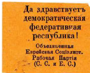
Рис. 2. 1917, Киев. ОЕСРП. Чёрная печать на жёлтой бумаге

РСДРП, и принял резолюцию о замене автономии федерацией. Поэтому в июле 1903-го на II съезде РСДРП (который должен был проходить в Брюсселе, а фактически состоялся в Лондоне) бундовцы по ряду вопросов оказались в оппозиции группе, возглавляемой В. И. Лениным. Вот как описана эта ситуация в «Кратком курсе истории ВКП(б)» 1938 года: «Бунд претендовал на особое положение в партии. Он требовал, чтобы его признали единственным представителем еврейских рабочих в России... После того, как съезд отверг требование Бунда признать его единственным представителем еврейского пролетариата, Бунд, представленный на съезде пятью делегатами, вышел из партии, вместе с экономистами, в результате, оставшиеся с В. И. Лениным оказались в большинстве и стали именоваться большевиками, а их противники — меньшевиками». Спустя три года Бунд вновь вернулся в РСДРП на IV (Объединительном) съезде в Стокгольме и пребывал в её составе до 1912 года, когда на VI Пражской конференции был исключён из партии большевиков и перешёл на меньшевистские позиции.