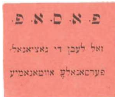
Рис. 8. 1917, Киев. 40×47 мм. Чёрная печать на тонкой розовой бумаге. Аббревиатура и текст на идиш: ОЕСР. «Да здравствует национально-персональная автономия»