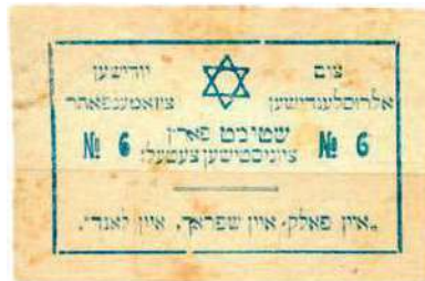
Рис. 24. Текст на идиш: На Всероссийский еврейский съезд. Голосуйте за сионистский список № 6. «Один народ, один язык, одна страна»