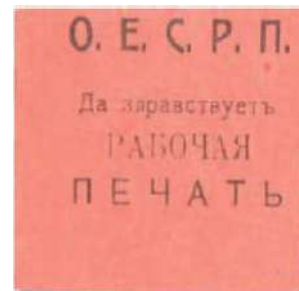
Рис. 12. 1917, Киев. Чёрная печать на тонкой розовой бумаге