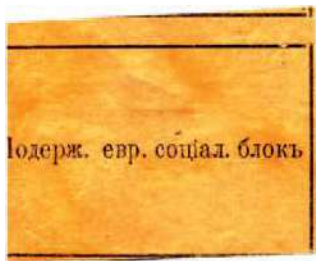
Рис. 17. 1917, Киев. Чёрная литографская печать на желтоватой тонкой бумаге. 53×40 мм, рамка 50×35 мм