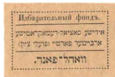
Рис. 28. Текст на идиш: Избирательный фонд. Еврейская социал-демократическая рабочая партия (Поалей-Цион)

литографским способом синей краской на рыхлой, теперь уже пожелтевшей от времени бумаге. Размер виньеток — 75 × 45 мм (размер рамки — 65 × 35 мм). Общая для всех надписей: «На Всероссийский еврейский съезд. Голосуйте за сионистский список №6», дополнена различными лозунгами на идиш или иврите.