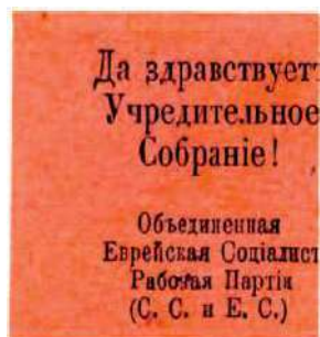
Рис. 3. 1917, Киев. ОЕСРП. 45×35 мм. Чёрная печать на розовой бумаге