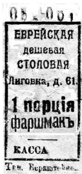
Рис. 10, 11

Следует отметить, что в настоящей заметке приведен наиболее полный список талонов из известных авторов литературных источников [4 - 7].