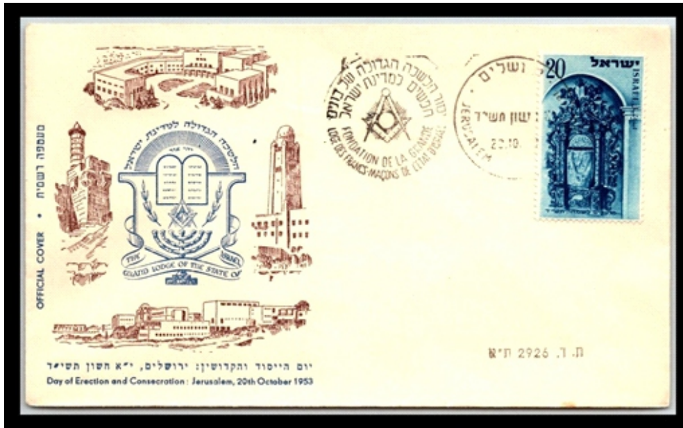
fig. 3 and 4

For the sixtieth anniversary of the Grand Lodge, the post office also produced a stamp with the emblem of the lodge and a special souvenir sheet (Fig. 5). Stamps are pasted on the sheet, which show photographs of the Jerusalem shrines of the three monotheistic religions: the Dome of the Rock (Islam), the Wailing Wall (Judaism) and the Church of the Holy Sepulcher (Christianity), as well as the basic principles of Freemasonry: freedom, equality, brotherhood, truth, help.