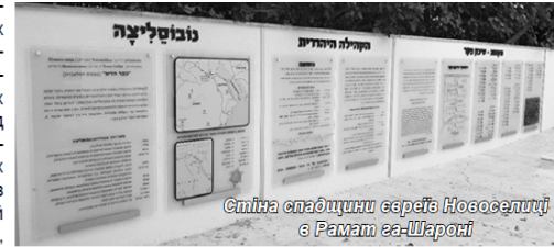
Стіна спадщини євреїв Новоселиці в Рамат га-Шароні

Володимир БЕРНШТАМ (Ізраїль), спеціально для газети «Тхія»